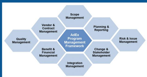
AdEx Program Management Framework

Im Lieferantenmanagement steht man oftmals nicht mehr nur einem Lieferanten gegenüber, sondern der Integration von Technologien verschiedener Anbieter und mehreren Implementierungspartnern.